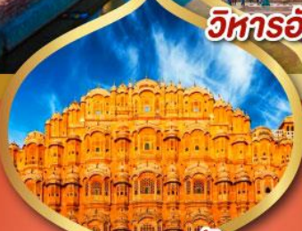
พระราชวัง สายลม