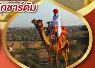
ฟรี ทัชฮิลล์ เมืองมันทวา ราคาเริ่มต้น

23-28 ม.ค.69 06-11, 20-25 ก.พ.69 13-18 มี.ค.69